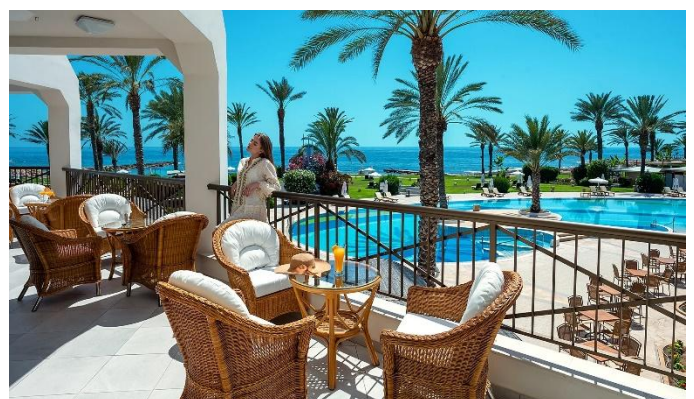
Constantinou Bros Athena Beach Hotel