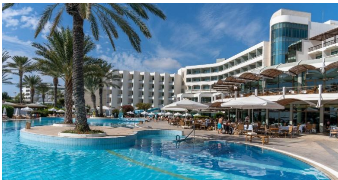
Constantinou Bros Athena Beach Hotel

Eine Bushaltestelle befindet sich direkt vor dem Hotel, und Taxis stehen jederzeit zur Verfügung.