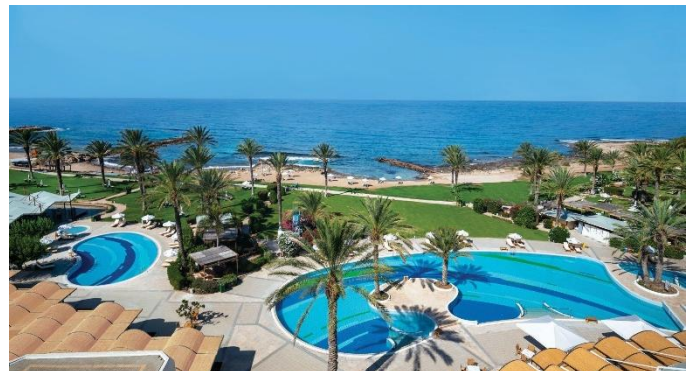
Constantinou Bros Athena Beach Hotel