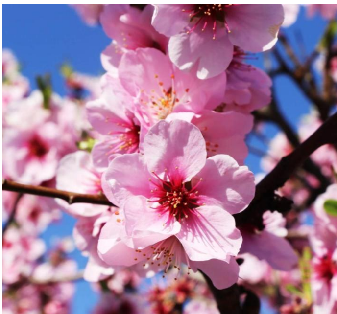
Blühender Mandelbaum auf Zypern

Bei Nichterreichen der Mindestteilnehmerzahl ist der Veranstalter berechtigt, den Kleingruppenzuschlag zu erheben. Der Kleingruppenzuschlag berechtigt nicht zum kostenlosen Rücktritt und gilt schon bei Buchung als Teil des Reisevertrags.