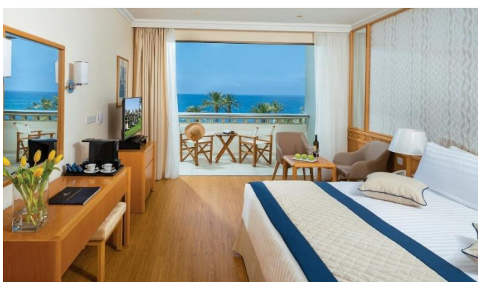
Constantinou Bros Athena Beach Hotel